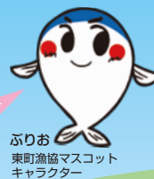
ぶりお 東町漁協マスコット キャラクター