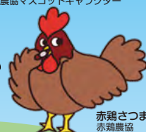
赤鷄さつま 赤鷄農協 マスコット キャラクター