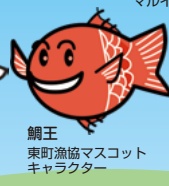
鯛王 東町漁協マスコット キャラクター