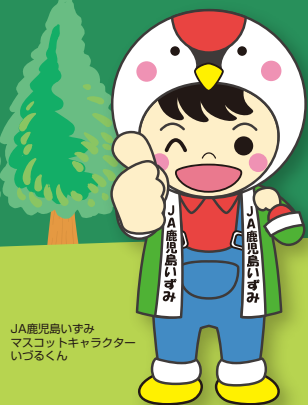
JA 鹿兒島いすみ マスコットキャラクター いづるくん

にじいろキッズフェスティバルは、7つの協同組合と鶴翔高校が力を合わせて、 みんなに環境や食について勉強してもらうためのフェスティバルだよ。 たくさんのお話を学んで、みんなの住んでいる町の素晴らしさを発見しよう。